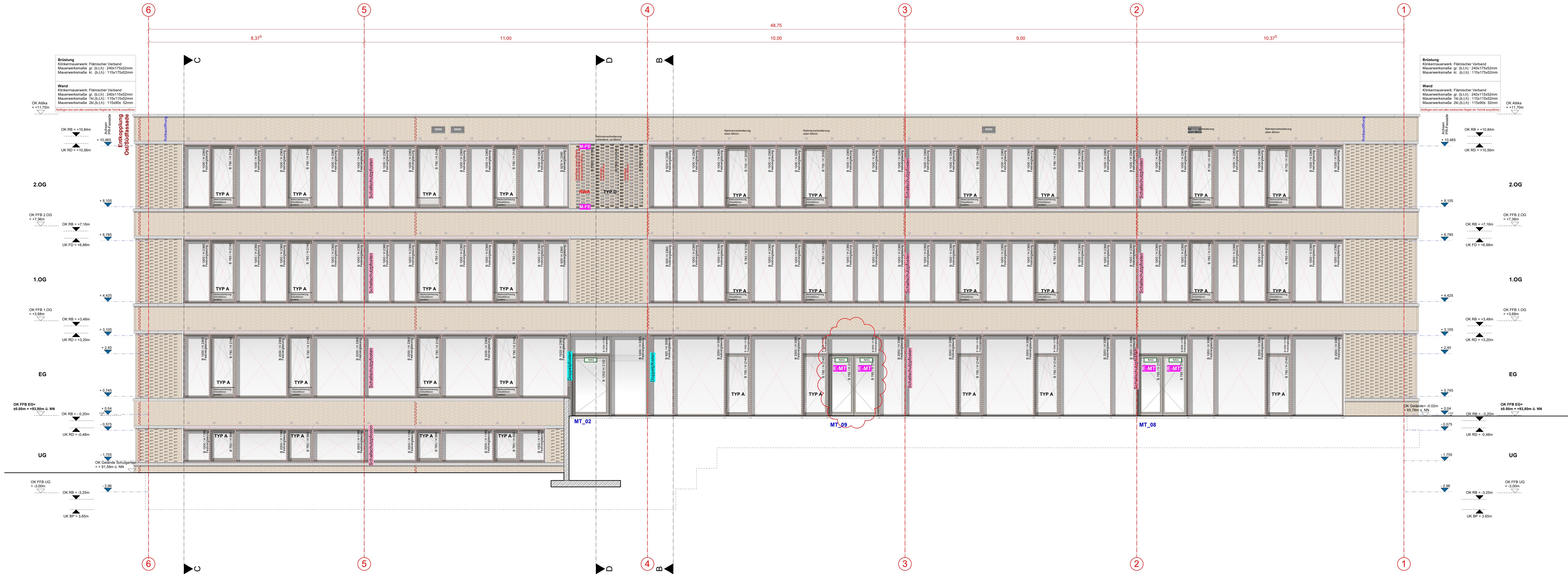
Ansicht 2_NORD-OST_M 1:50